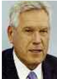
Michael Glos, Bundesminister für Wirtschaft und Technologie

„Ich wünsche allen Ausstellern und den Besucherinnen und Besuchern interessante Tage in München und gute Geschäfte auf der Internet World!“